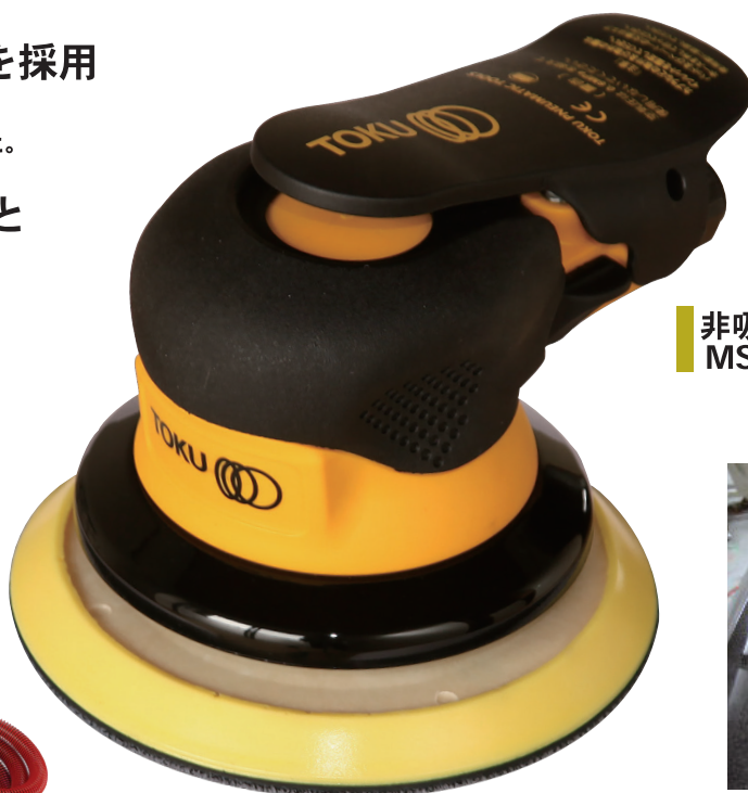
非吸塵タイプ MS-780N6-5 (パッド 125mm タイプ)

バランスウェイトの改良 により、特に低回転時の 研磨に威力を発揮し、 作業効率を高めます。