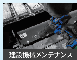
建設機械メンテナンス