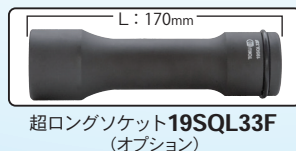
超ロングソケット19SQL33F (オプション)