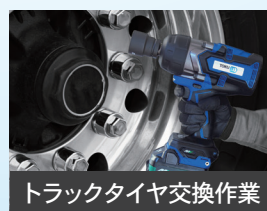
トラックタイヤ交換作業